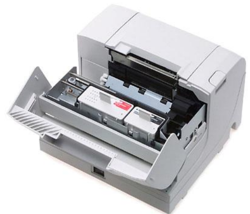
2 großvolumige Tintentanks sorgen für langes Drucken und niedrige Kosten