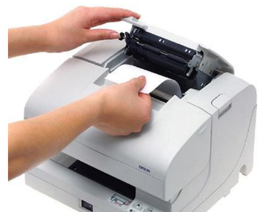
Aufklappen, Rolle einlegen, zuklappen! So einfach geht es bei allen TM-J